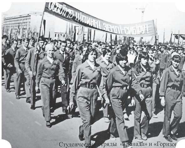
Студенческие отряды «Рысь» и «Горизонт»