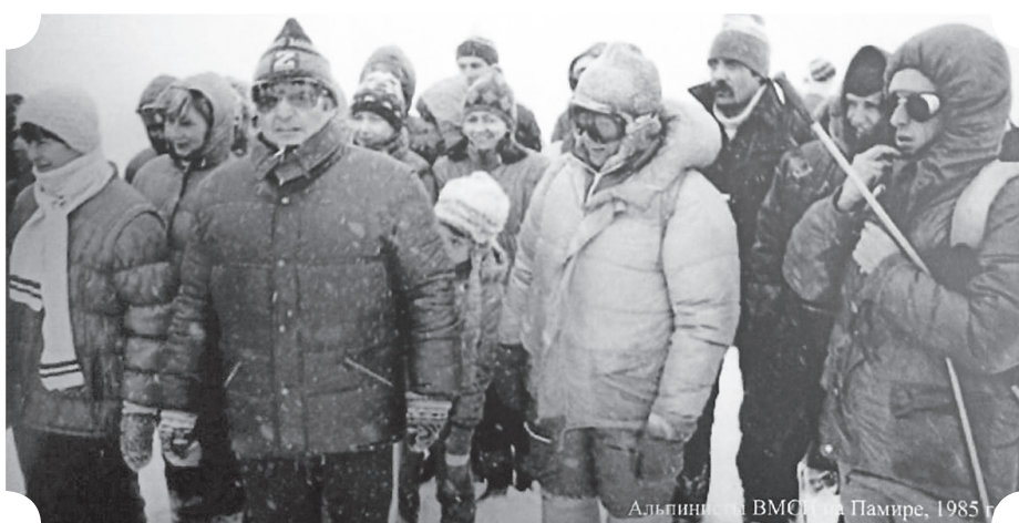
Альпинизм ВМСИ на Памире, 1985 г.