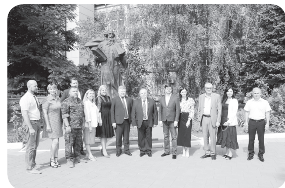
Центр медиа-информационной политики ЛГУ им.В.Даля