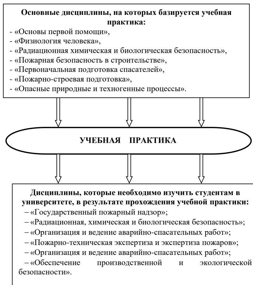
Рисунок 1 – Взаимосвязь учебной практики с другими дисциплинами

знать: методы анализа взаимодействия человека и его деятельности со средой обитания; риск-содержание опасных производственных объектов (виды, классификацию, поля действия, источники возникновения, теорию защиты); способы защиты субъектов хозяйствования от опасностей; технологические процессы основных групп опасных производственных объектов Луганской Народной Республики; организацию и планирование рабочего места, условия обеспечения безопасности труда; социальные и экологические последствия применения технологий, использования вторичного сырья и отходов производства;