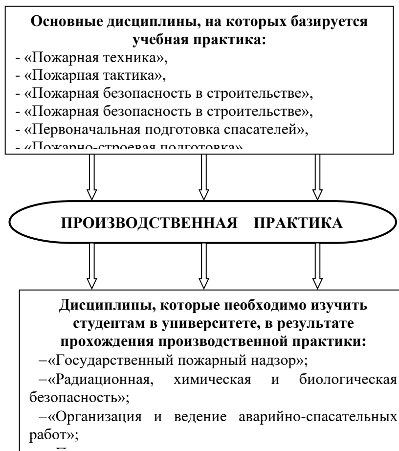
Рисунок 1 – Взаимосвязь производственной практики с другими дисциплинами

знать: методы анализа взаимодействия человека и его деятельности со средой обитания; риск-содержание опасных производственных объектов (виды, классификацию, поля действия, источники возникновения, теорию защиты); способы защиты субъектов хозяйствования от опасностей; технологические процессы основных групп опасных производственных объектов Луганской Народной Республики; организацию и планирование рабочего места, условия обеспечения безопасности труда; социальные и экологические последствия применения технологий, использования вторичного сырья и отходов производства;