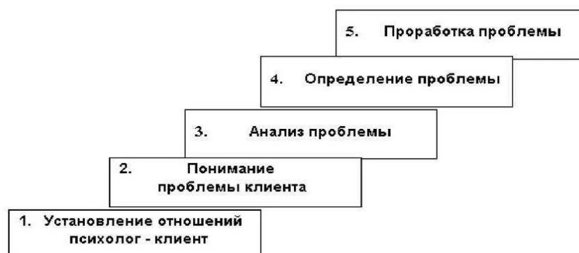
Рис. 2.1. Этапы психологического консультирования

При включении в работу фотографий их следует наклеивать на стандартные листы белой бумаги. Они могут приводиться как в тексте разделов, так и в приложении и обозначаются так же, как и иллюстрации.