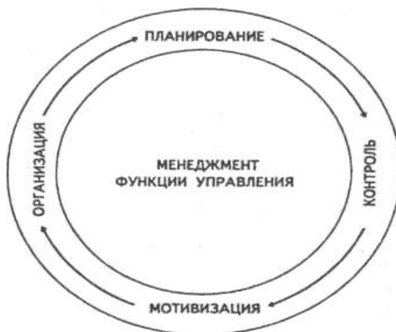
Рис.2.1. Функции психологии управления

При включении в работу фотографий их следует наклеивать на стандартные листы белой бумаги. Они могут приводиться как в тексте разделов, так и в приложении и обозначаются так же, как и иллюстрации.