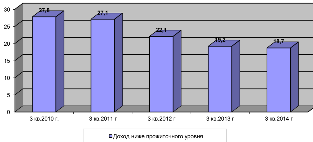
Рисунок 1 – Изменение доли населения с доходами ниже прожиточного минимума за 3 квартал 2010-2014 гг. (в процентах к общей численности населения) 2