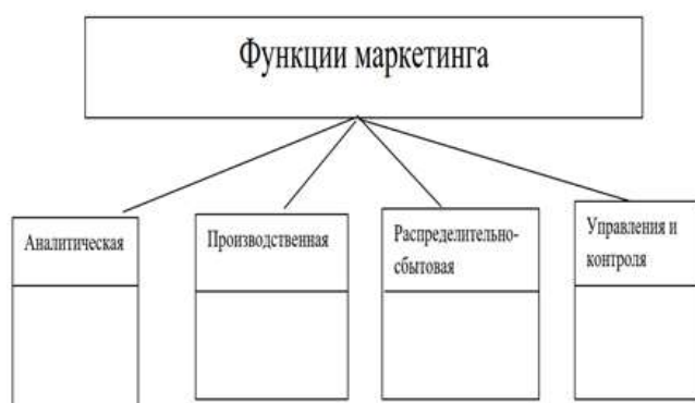
Рисунок 1.1 – Функции маркетинга

3. К какому виду маркетинговой среды относятся субъекты и факторы (1-внутренняя микросреда, 2-внешняя микросреда, 3-макросреда):