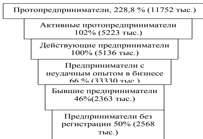
Рисунок 2 – Структура предпринимательских слоев населения