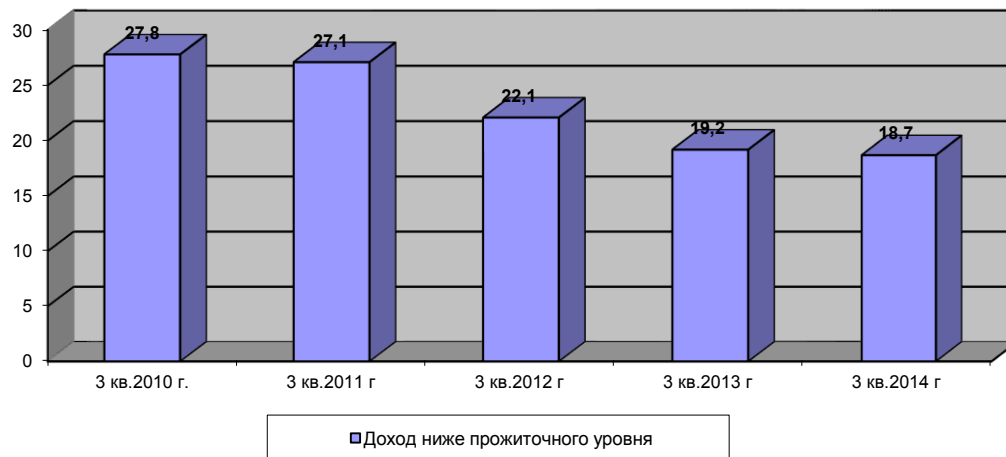
Рисунок 1 – Изменение доли населения с доходами ниже прожиточного минимума за 3 квартал 2010-2014 гг. (в процентах к общей численности населения) 2